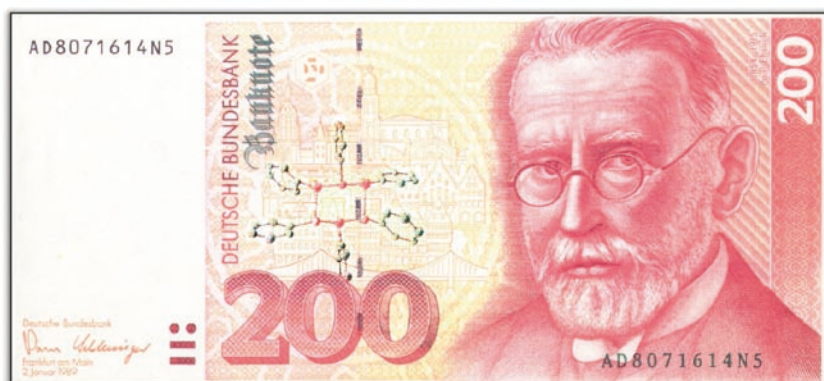
PAUL EHRLICH und seine Schöpfung: das Salvarsan.

Die Frage, ob Arsen für den Menschen ein Spurenelement ist oder nicht, ist noch nicht beantwortet. Eine tägliche Aufnahme von bis zu 1 mg Arsen gilt als harmlos. Für bestimmte Tiere ist Arsen ein essenzielles Spurenelement. Hühner oder Ratten zeigen bei arsenfreier Ernährung deutliche Wachstumsstörungen. Meerestiere wie Muscheln oder Garnelen und zahlreiche Algen enthalten nennenswerte Mengen Arsen. Lösliche Arsenverbindungen werden vom Menschen intestinal aufgenommen und innerhalb